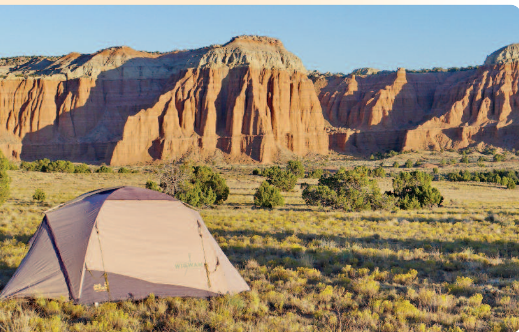
Camp im Escalante NP

INDIANER-LAND Tage 9/10/11/12/13 Mesa Verde, Monument Valley und Canyon de Chelly sind Stationen, bei denen Sie das Lebensgefühl der Indianer nachempfinden können. Tage 9/10: Mesa Verde Nationalpark, mit über