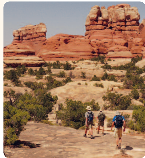
Wandern im Canyonlands NP