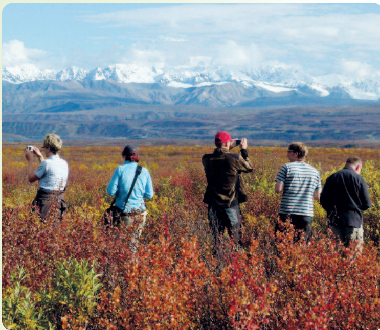
Die extremen Jahreszeiten erleben: Herbst in Tundra und Taiga

„Trans Alaska Pipeline“, die heißes Öl von der Prudhoe Bay am Nordpolarmeer bis zum eisfreien Hafen von Valdez an die Pazifikküste befördert. 1xÜN in Tok, ein kleiner Versorgungsort am legendären Alaska Highway.