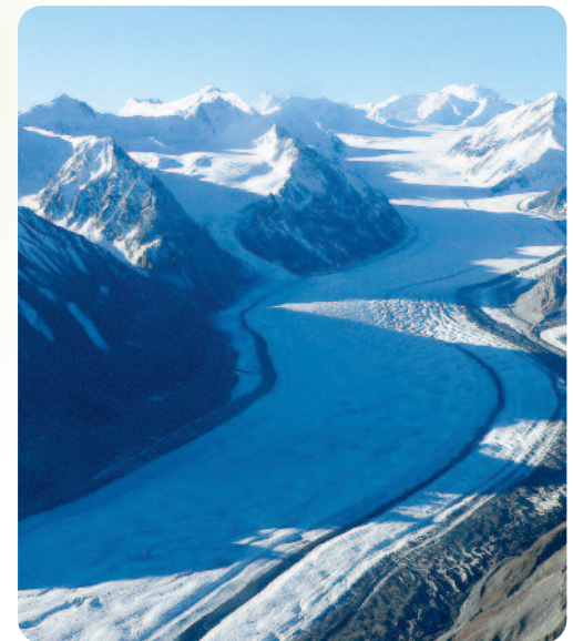
Rundflug über den Kluane Nationalpark

KLUANE NATIONALPARK Tage 5/6 Wir folgen dem berühmten Alaska Highway noch ein Stück weiter mit den Kranichen und Kanadagänsen in Richtung Yukon. Am riesigen Kluane Lake erwartet uns eine spektakuläre Bergwelt. Hinter den Randgebirgen der Kluane Range verbirgt sich das größte zusammenhängende Gletschergebiet der Erde außerhalb der Polarzonen: Gletscher mit über 60 km Länge und mehr als 7 km Breite, ca. 30 Berggipfel über 4.000 Meter. – Wanderung vor der Kulisse des 5.960 m hohen Mt. Logan, ein Massiv aus Eis und Fels. – spektakulärer Rundflug mit Buschpiloten über die endlose Gletscherwelt des Kluane Nationalparks (fakultativ, da wetterabhängig). 2xÜN in einfacher Pension am Kluane Lake (annähernd so groß wie der Bodensee - aber nur 300 Menschen siedeln an den Ufern!). Auf dem Weg durch die subarktischen Gebiete Alaskas entdecken wir je nach Jahreszeit die großen und kleinen Naturwunder. Im Frühjahr protzen die Südhänge der Berge mit ihrem Blumenreichtum – im Herbst begleiten uns die Gruppen von Kronenkranichen auf dem Weg durch die tiefrot gefärbte Landschaft.