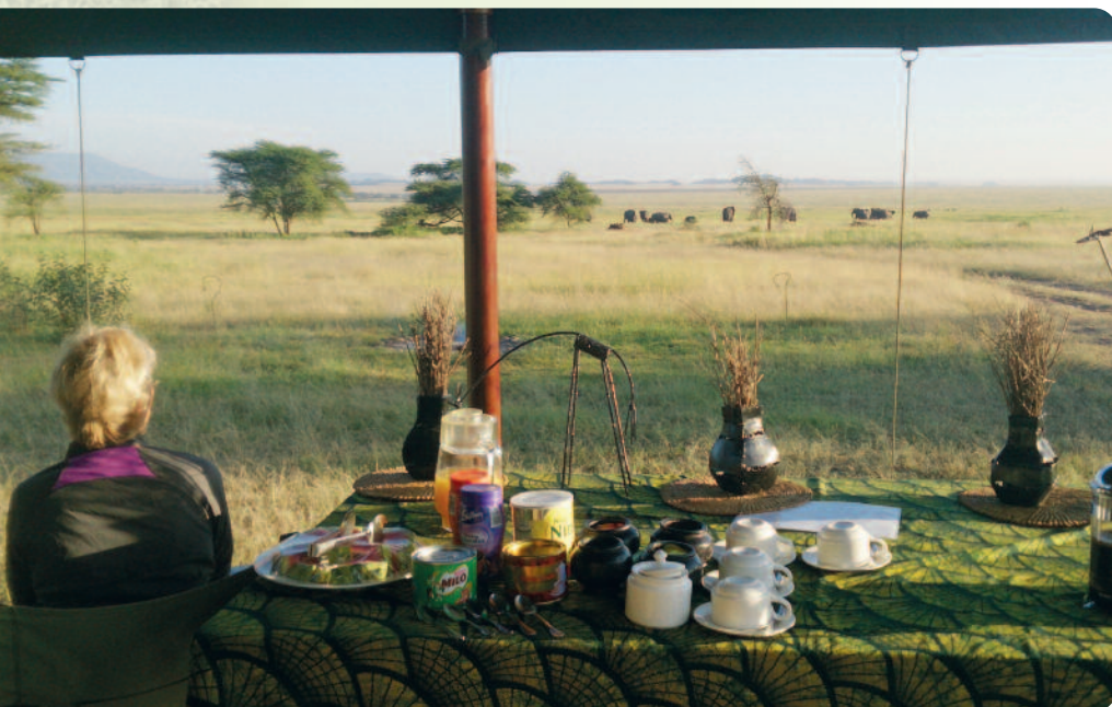
Kaffee mit Ausblick

Ein langer Fahrtag führt uns auf staubiger Piste durch die Uluguru Berge bis nach Morogoro. Wir passieren vereinzelt Dörfer, deren Bevölkerung von der Landwirtschaft lebt. Die Uluguru Berge sind Teil des Eastern Arc Escarpments und sehr fruchtbar. Je nach Ankunftszeit haben wir Zeit über den Markt in Morogoro zu schlendern. Anschließend Weiterfahrt in den Mikumi Nationalpark.