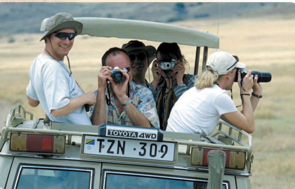
Safari im Ngorongoro Krater

Eine authentische und umfassende Reise voller Abwechslung und Aktivitäten, um die phantastische Tierwelt, überragende Landschaften und interessante Kulturen Tanzanias während einer abenteuerlichen Reise zu erleben.