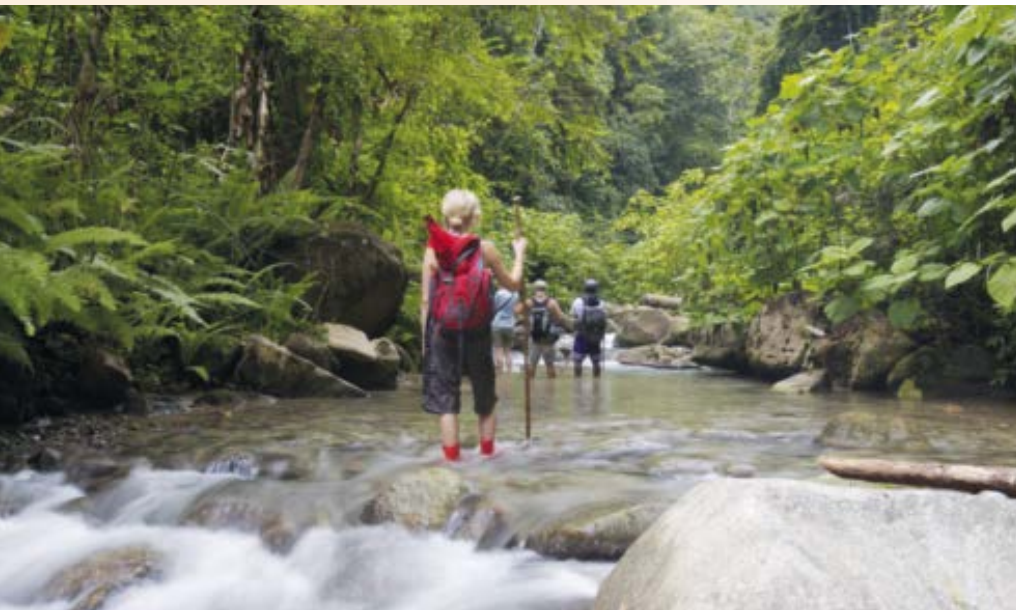
Zu Fuß über den Isthmus von Panama