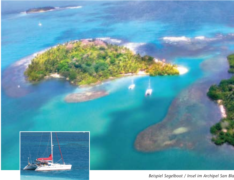
Beispiel Segelboot / Insel im Archipel San Blas

cheln und Faulenzen stehen definitiv an der Tagesordnung. Wir werden im Laufe des Tages von einem Segelboot abgeholt und verbringen noch mehrere Tage auf nahezu einsamen Inseln innerhalb des Archipels. Wir genießen das Gefühl von "Robinson Crusoe" und ernähren uns von frischen Meeresfrüchten wie Fisch oder Hummer, dazu viel Obst und dem typischen Kokosreis. An Bord unseres Segelbootes übernachten wir in Kajüten oder, wer möchte, auch auf dem Deck.