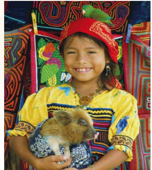
Herzlich Willkommen bei den "Kunas"

Am Tag 5 öffnet sich mehr und mehr der Blick auf die Küste und die vorgelagerten San Blas Inseln. Wanderung am Fluss hinunter weiter durch den Regenwald bis zum Dorf Cangandi (ca. 3-4 Std.). Wir werden von den freundlichen