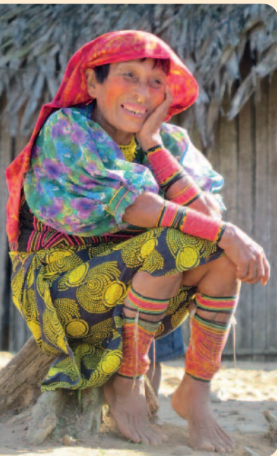
Bei den Kuna

Am Tag 6 ist es soweit: Karibikküste! Nach einer kurzen Wanderung geht es mit dem Boot durch