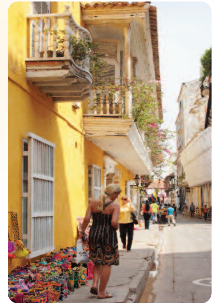
Koloniales Cartagena