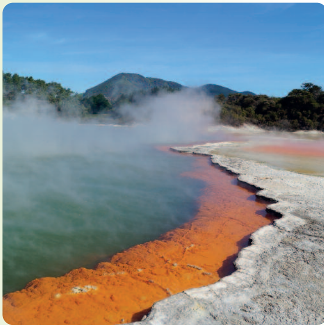
Wandern im Tongariro / Whakarewarewa