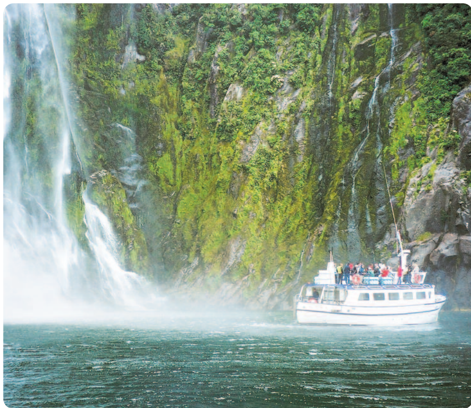
Bootstour im Milford Sound