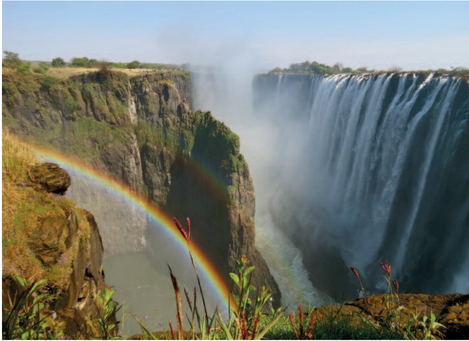
„Mosi-oa-Tunya“ – die donnernden Victoria-Fälle

SOUTH LUANGWA NP Tage 9/10/11 Auf steiniger Allradstrecke und sandiger Piste durch die bergige Buschlandschaft auf dem Weg in eines der atemberaubendsten Tierreservate der Welt, dem South Luangwa Nationalpark. Die Konzentration der Tierwelt um den Luangwa Fluss ist eine der Höchsten in ganz Afrika. Heimat für Elefanten, Giraffen, Leoparden, Büffel, Zebras, Krokodile, Flusspferde u.v.a. mehr. Wandersafaris sind neben traditionellen Pirschfahrten nach wie vor die beste Art, diese wilde und unberührte Natur kennenzulernen. Die Wildnis zu Fuß erkunden und das prickelnde Gefühl, mit der Tierwelt „Eins“ zu sein. Es besteht sogar die Möglichkeit, die Walking-Safari mit einer Übernachtung im Buschcamp zu verbinden und die Nacht im „Real Outback“ zu verbringen. Mehrere Pirschfahrten zu Tage und in der Nacht, wenn die Chancen, einen Leopard zu beobachten, besonders groß sind. Übernachtung in einem Camp, wo sich immer wieder Elefanten „verirren“, um die Früchte der Marula-Bäume zu naschen. 4 Tage verbringen wir im Gebiet des Luambe und South Luangwa NP - ein großer Schwerpunkt dieser Reise. 3x Lodge-ÜN. F/P/A