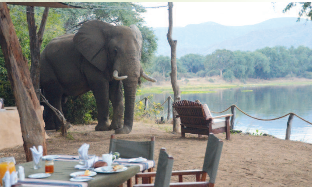
Besuch beim Frühstück - "Tented Camp" am Luangwa-Fluss

14 oder 22 Tage Reise mit speziellem Allrad-Safari-Fahrzeug in einer der besten Safari-Destinationen weltweit.