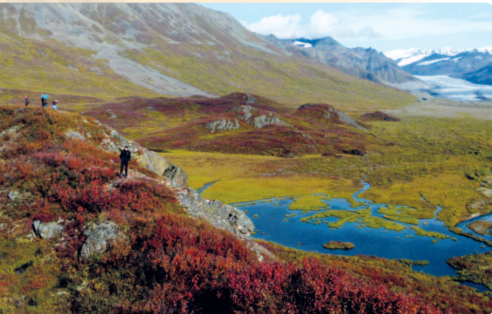
Wandern in der Alaska Range

Wir nehmen uns Zeit für eine Gletscherwanderung in den Coast Mountains, aus denen sich der gewaltige Matanuska-Glacier als weißes Band tief hinab ins Tal zieht. Wir durchqueren Indianersiedlungen am Copper- und Tanana-River, bestaunen die bis zu 5.000m hohen Vulkanberge der Wrangell-Mountains und die endlose Wildnis