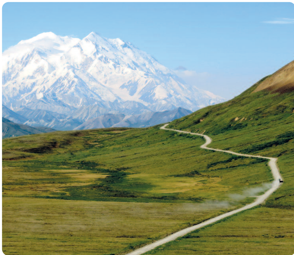
Am Fuße des Denali/Mt. Mc. Kinley, 6.184m, im Denali Nationalpark

NORDWÄRTS BIS INUVIK Tage 9 bis 13 Whitehorse ist am 9. Tag wieder eine größere Siedlung und Versorgungsstation.