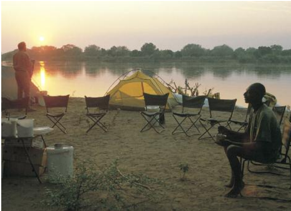
Ufercamp über dem Luangwa

unserem Camp? Zudem eine spannende Nacht- pirschfahrt mit, für ihre Spürnase nach Leoparden berühmten, Wildhütern. Ein prickelndes Aben- teuer und vielleicht haben wir das Glück, eine Jagd dieser Raubkatzen mitzuverfolgen. Geplant sind Zelt-ÜN und zum Abschluss der Tage im Luangwa-Tal gönnen wir uns eine gemütliche Lodge. Nach einer letzten Morgen- pirsch am Tag 12 verlassen wir den South Luang- wa, nach Möglichkeit auf der legendären Petau- ke-Road im Süden des Parks. Buschcamp. Bei allen Zelt-ÜN im Luangwa-Tal F/P/A.