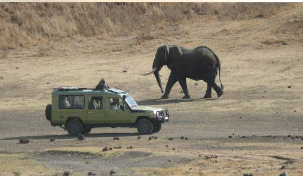
Elefant des Luangwa Tals

Zu Füßen des steilen Muchinga Escarpement gelegen, bietet der über 4000 km 2 große North Luangwa Nationalpark Tausenden von Wildtieren einen unberührten Lebensraum. Büffelherden, Löwen und Raubkatzen können wir in dieser einsamen und von Touristen extrem selten besuchten Wildnis finden. Mit einem erfahrenen Ranger auf Fußpirsch-Safaris und mit unserem Safari-