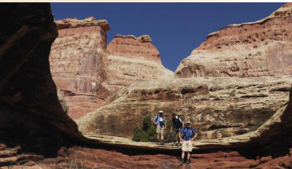
Wandern im "Red Rock Country"

Diesen Teil der Tour, der Ihnen sicher noch lange unvergesslich bleibt, beschließt ein phantastischer Rundflug über sämtliche Gebiete des Canyonlands- und Arches Nationalpark und das Schluchtensystem des Colorado und Green Rivers.