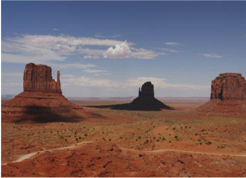
Kulisse im Monument Valley