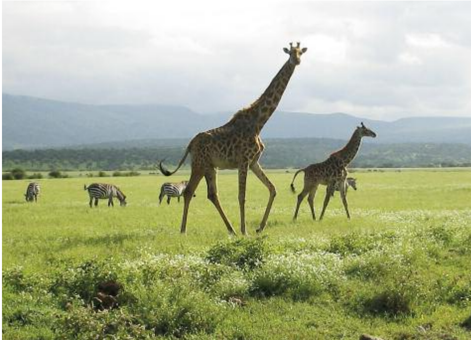
Immer wieder beeindruckend: Safarierlebnisse in Ostafrika

menschlichen Entwicklungsgeschichte archiviert und dokumentiert sind. Eine besondere Erscheinung des afrikanischen Grabenbruchs ist die Entwicklung des Lebensraumes im Ngorongoro Krater. In der fruchtbaren Vulkanlandschaft ist ein Tierparadies par excellence entstanden. Lodgeübernachtung Ngorongoro. F/P/A Am nächsten Morgen unternehmen wir eine ausgedehnte Pirschfahrt im Ngorongoro-Krater. Bernhard Grzimek sagte einmal: „Es ist unmöglich, in Worten die Größe und Schönheit des Kraters wiederzugeben. Er ist eines der Weltwunder.“ Vom Kraterand (2286m) hat man einen grandiosen Blick auf diesen „Garten Eden“. Riesige Herden von Zebras und Gnus ziehen durch das 259 km 2 große Areal aus Steppe, Seen und Buschland. Der Krater ist nur per Allradfahrzeug befahrbar. Nashörner, Elefanten, Löwen und Geparden können dabei gesichtet werden. In den Wasserlöchern halten sich Flusspferde auf. Ein kleines Stück weiter übernachten wir in einer schönen Lodge in Karatu. F/P/A