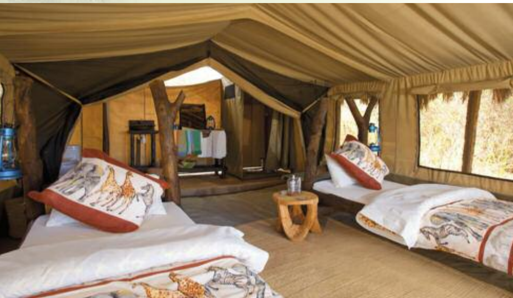
Lake Eyasi: Tindiga Tented Camp

Auf den Spuren der Buschmänner Afrikas am Lake Eyasi.