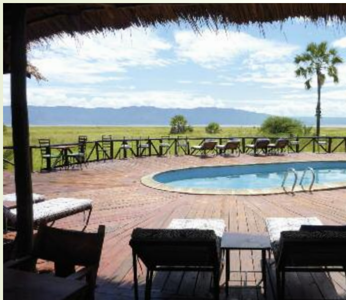
In Lodges und Tented Camps

den mächtigen Rufiji River fließen. Eine Bootstour auf dem Rufiji, zu Flusspferden und sich am Flussufer sonnenden Krokodilen ist ein Highlight im Selous. In den lichten Savannen tauchen die ersten Elefantenherden auf, die mit ca. 50.000 ihrer Art die größte Population an Dickhäutern in Afrika darstellt. Sie zu entdecken verbringen wir den heutigen Nachmittag auf einer ausgedehnten Landrover-Safari durch den afrikanischen Busch. Vielleicht entdecken wir zwischen den mit Borasso-Palmen bestandenen Savannen sogar Löwen oder Leoparden. Eine der Besonderheiten des Selous ist der Afrikanische Wildhund, der mittlerweile zu den seltensten Säugetierarten auf dem Kontinent zählt. 3 Tage verbringen wir in dieser Wildnis mit Fußsafaris, Bootstour auf dem Rufiji-River und Safarifahrten. Beim Sonnenuntergang genießen wir entspannt unseren „Sun-downer“ im Tented Camp. Das „Wilderness Tented Camp“ ist neu errichtet und bietet für Kleingruppen idealen Platz. Es besteht aus lediglich 8 Hauszelten, in denen je 2 Betten eingerichtet sind sowie ein privates Bad mit Dusche und Toilette. Inmitten der freien Natur aufgebaut vermitteln die „Tented Camps“ ein Gefühl, als ob man draußen schläft. 3x ÜN. F/P/A