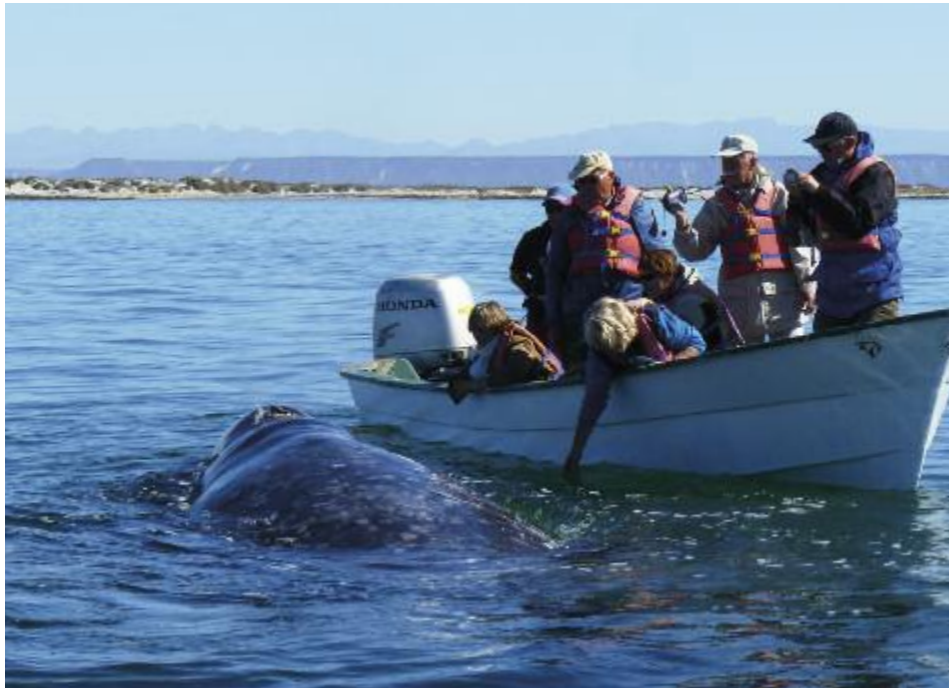
Walbeobachtung in den Lagunen der Baja California

und April halten sich eine Vielzahl von Grauwal in den Lagunen auf, um ihre Jungen zu gebären und großzuziehen. Mit etwas Glück nähert sich einer der "Giganten der Meere" bis dicht an unser Boot. Zu den Herbstterminen Okt/Nov konzentriert sich die Walbeobachtung auf den Golf von Kalifornien, in welchem 12 verschiedene Walarten entlang der Küsten ziehen, u.a. der Finnwal, zweitgrößter Wal der Welt! 3 ÜN in San Ignacio, 1 ÜN in Guerrero Negro.