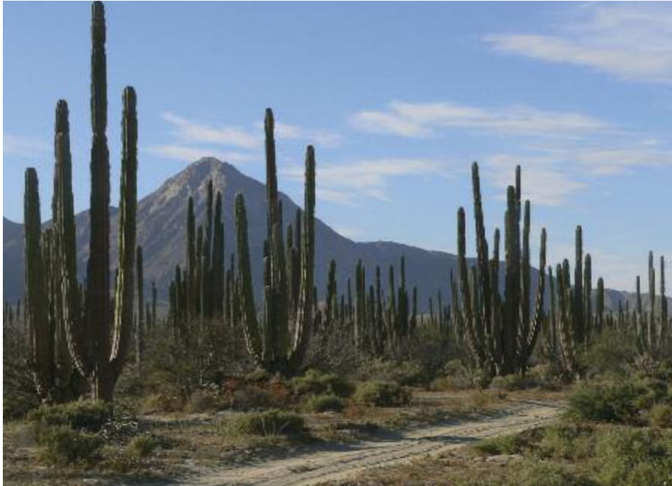
Kakteenwald in der Desierto Central

Alaskas bis in die ruhigen Buchten der Baja California, um hier ihren Nachwuchs aufzuziehen. Ruhig und gemächlich gleiten die Wale durch das Wasser. Ebenso behutsam nähern wir uns in kleinen Fischerbooten den bis zu 15m langen Grauwalen, die sich oft selbst neugierig und vorsichtig "hautnah" an die Boote heranwagen. Eine aufregende Begegnung mit den größten Säugetieren dieser Erde. Nach diesem Erlebnis brechen wir am Nachmittag unsere Zelte an der Pazifikküste ab und erreichen über eine holprige Bergstraße den Ausgangspunkt für die bevorstehende Expedition in die Bergwelt der Baja.