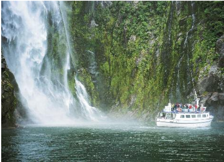
Bootstour im Milford Sound

Stadt Dunedin sowie zu einem beeindruckenden privaten Schutzprojekt für die seltenen Gelbaugepinguine, wo es uns versteckte Grabengänge ermöglichen, die possierlichen Tiere unbemerkt zu beobachten. Dazu eine beschauliche Küstenwanderung auf der Otago Halbinsel.