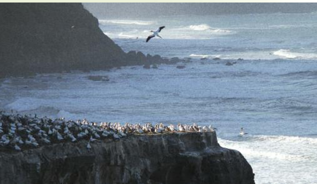
Basstölpel-Kolonie bei Muriwai

Pottwale in Kaikoura, Pinguine auf Otago, Albatrosse und Vogelkolonien zwischen Tasman-See und Pazifik. Eine Naturreise zu bekannten Highlights und unbekanntem Ecken am Ende der Welt.