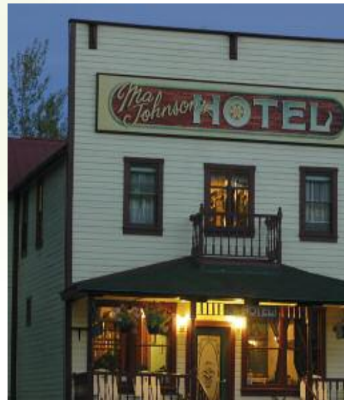
Abends in gemütlicher Unterkunft

3./4.Tag: Bei schönem Wetter haben wir heute die Möglichkeit, an einer einzigartigen Schiffsfahrt im Kenai Fjords Nationalpark teilzunehmen (fakultativ). Orkas, Delfine, Buckelwale und Seelöwen begleiten uns auf dem Weg zu kalbenden Gletschern. Die Chiswell Inseln ragen nahezu senk-