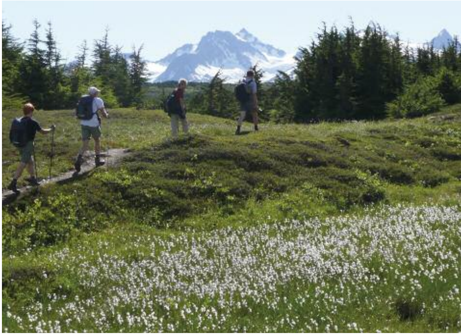
Tagsüber aktiv sein.