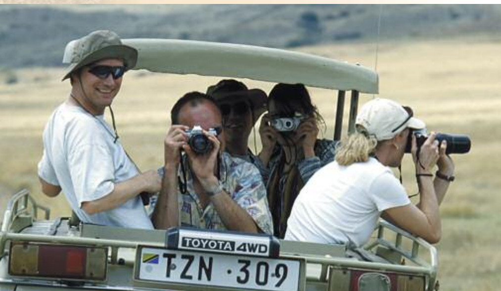
Safari im Ngorongoro Krater