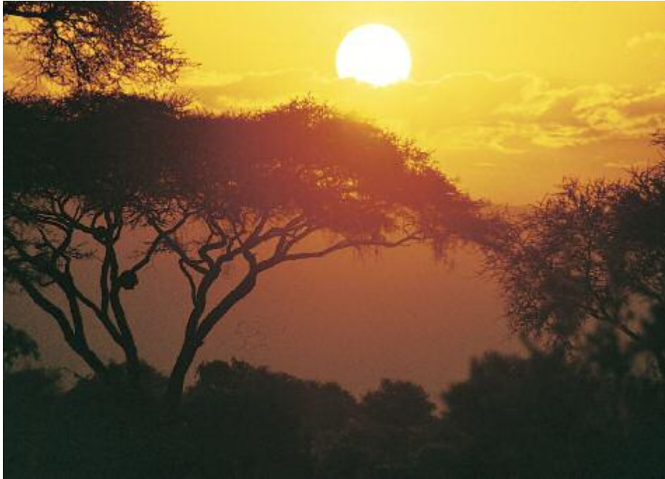
Abendstimmung in der Serengeti

LAKE NATRON & LENGAI Tage 9/10 Auf einer landschaftlich ausgesprochen schönen Bergstrecke geht es über den ostafrikanischen Grabenbruch hinunter zum Lake Natron. Zigttausende Flamingos bilden einen rosafarbenen Teppich auf dem Wasser. Wanderung zwischen Baobab-Bäumen zu einem versteckten Wasserfall und zum Sonnenuntergang am Lake Natron. Gelegenheit, den heiligen Berg der Massai, Ol Doinyo Lengai, zu besteigen. Mitten im Stammesgebiet der Massai lagern wir am Flussufer und haben Zeit für interessante Begegnungen mit dem stolzen Nomadenvolk. Camp-ÜN. F/P/A