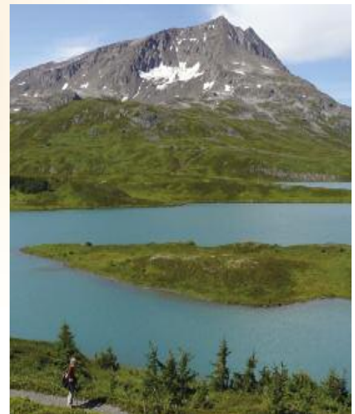
Wildniswanderung auf der Kenai Halbinsel

Tage 2/3/4 Nach einer ersten Tourbesprechung geht unser Weg nach Süden, am Cook Inlet entlang zur Kenai-Halbinsel, wo alljährlich Millionen Lachse die Flüsse zu ihren Laichplätzen hinaufziehen. Erstes Camp an den Ufern des malerischen Kenai-See für 3 Nächte. Ideal zur Zeitumstellung und als Ausgangspunkt für die nächsten zwei Tage.