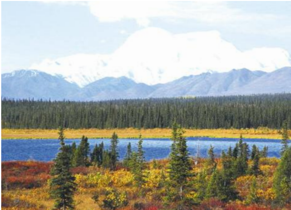
Am Fuße des Mt. Mc. Kinley, 6984m, im Denali Nationalpark