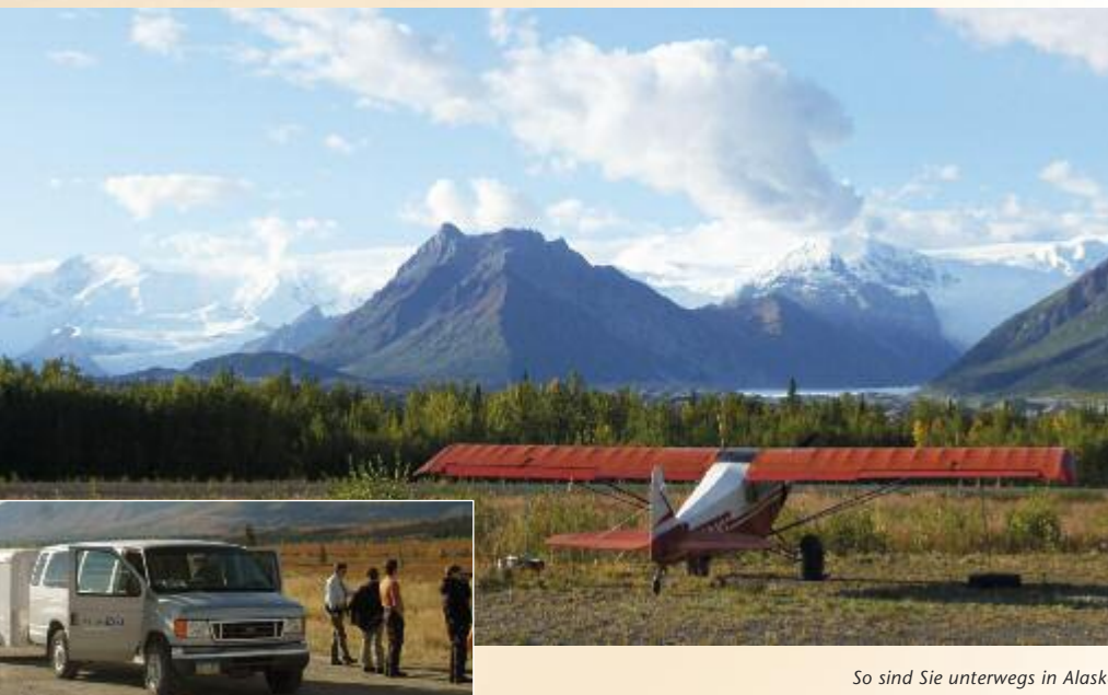
So sind Sie unterwegs in Alaska